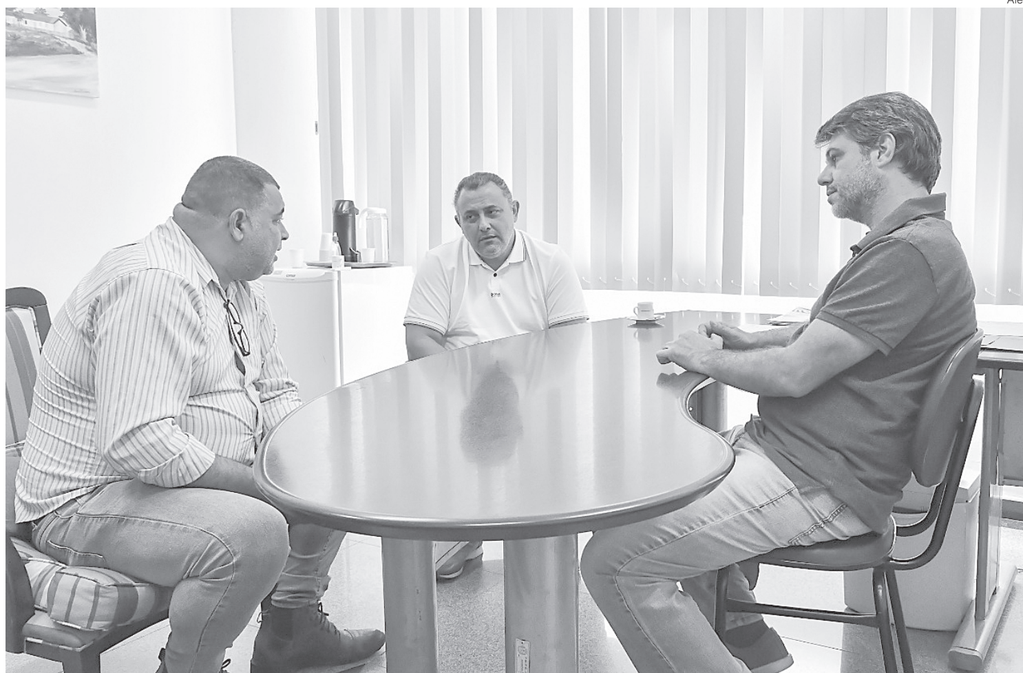
Setor de construção naval é importante para recuperação econômica do Estado do Rio, dizem integrantes de comissão

O engenheiro também falou que o setor precisa de investimento do Governo para se desenvolver. “Não temos como construir um navio mais barato do que a China, por exemplo, mas