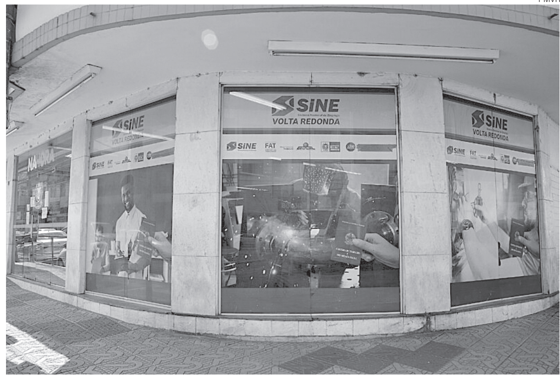
Cidades oferecem vagas para pessoas com deficiência

Em Porto Real, as vagas são para amarrador, motorista categoria D, eletricitista predial, atendente de lanchonete, e frentista.