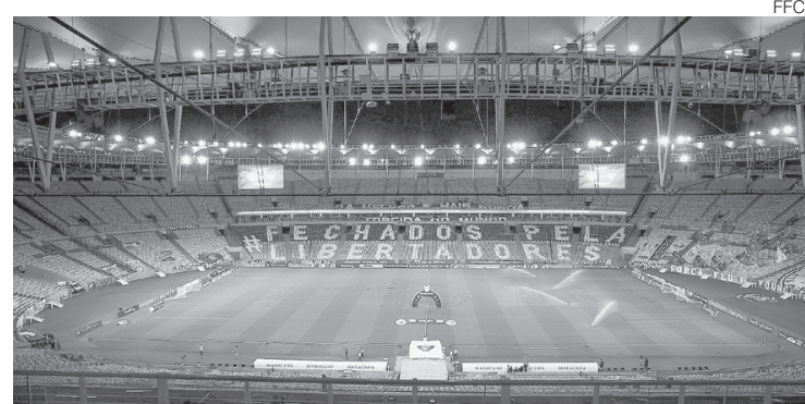
Tricolor havia solicitado à Secretaria Municipal de Saúde evento teste na partida da Libertadores

O clube disse que a gestão municipal entende que “o protocolo apresentado mostrou-se bastante adequado, com necessidade de pequenas correções”. E