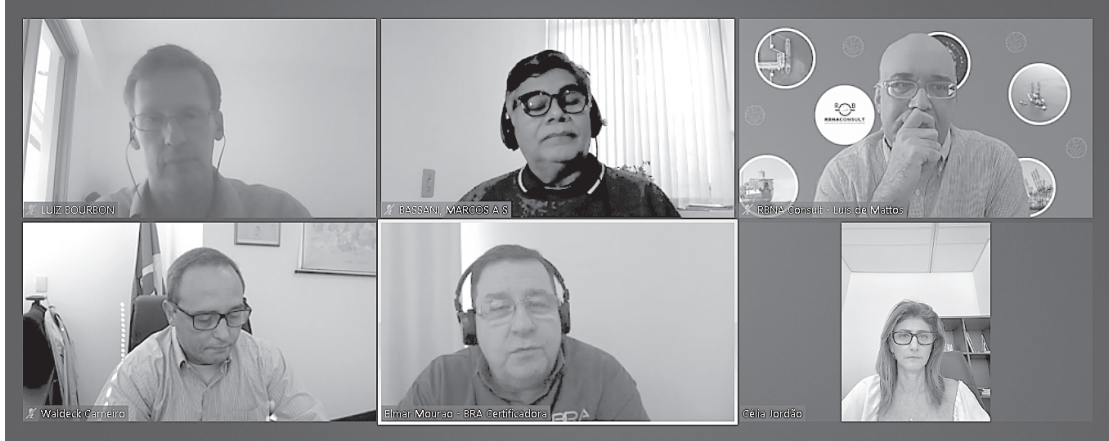
Deputado anuncia verba para Agricultura de Porto Real