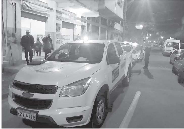
Entre sexta-feira (6) e domingo (8) os agentes autuaram e notificaram outros estabelecimentos

A força-tarefa da prefeitura de Volta Redonda, criada para fiscalizar as atividades econômicas e as medidas de saúde durante a pandemia de Covid-19, fechou três comércios durante atuação no último fim de semana. No período entre sexta-feira (6) e domingo (8), os agentes ainda autuaram e notificaram outros estabelecimentos.